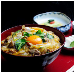
名古屋コーチン親子丼 ¥2,530