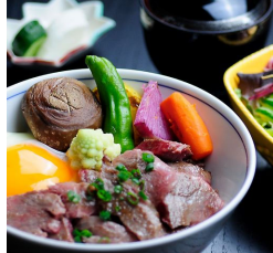
米沢牛ステーキ丼 ¥2,970 1日5食限定