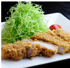
とんかつ (200g) ～米沢豚一番育ち～ ¥3,080