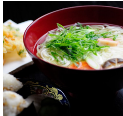
うどん御膳 (冷or温) ¥2,530