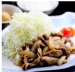
生姜焼き (200g) ～米沢豚一番育ち～ ¥2,750