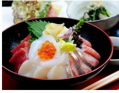
海鮮ちらし ¥4,180 1日5食限定