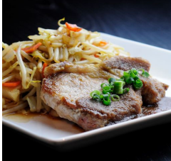
米沢ポークステーキ ¥2,750