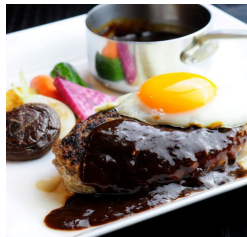
米沢牛ハンバーグ ¥2,750